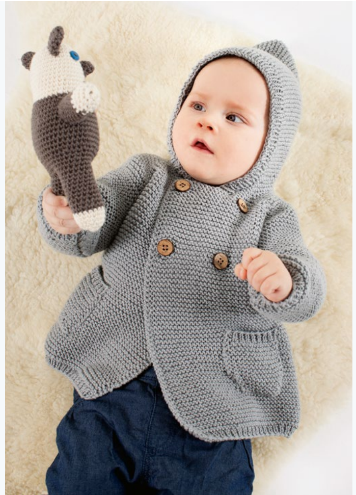
Oppskrift til kosedyr. Modell 339-09

Alternativ til LERKE: PURE ECO WOOL, NATURAL LANOLIN WOLL, FALK eller HEILO