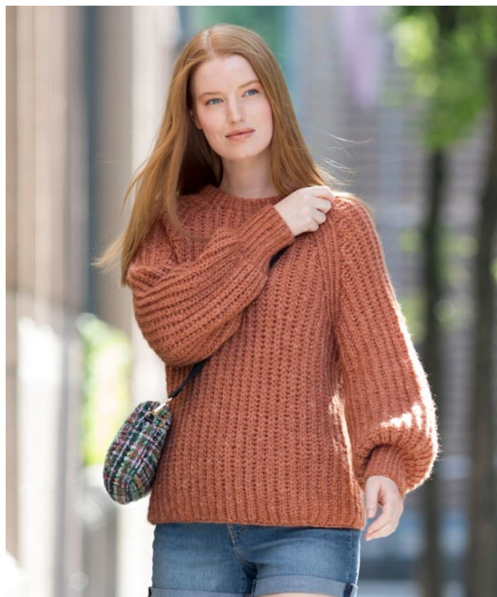
Se også som ensfarget | DG419-06