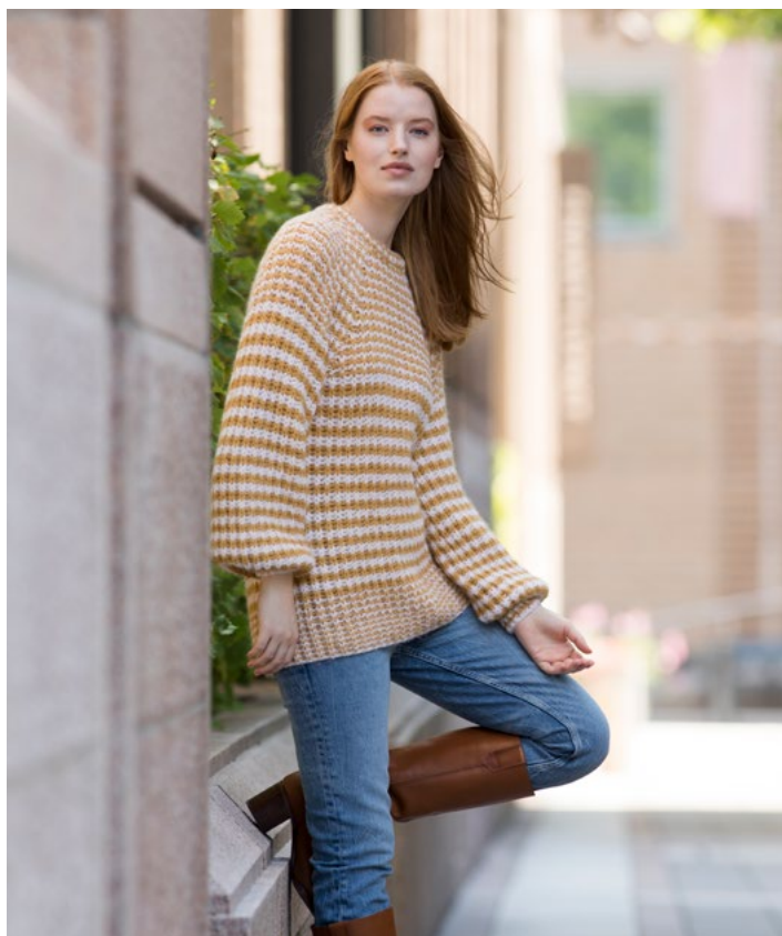
Se også i gul striper | DG419-05