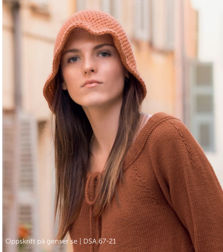
Oppskrift på genser se | DSA 67-21

Stram forsiktig i «oppleggstråden» slik at hullet i toppen blir minst mulig.