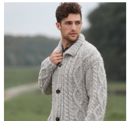
Prøv kardiganen i gråbrun | DSA68-07