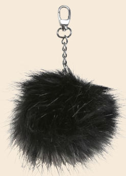
Pompon Charm m. Metalkæde - 11 cm