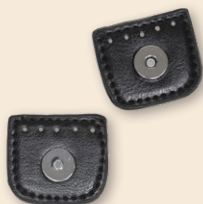
Magnet knap m. Flap - 4 cm