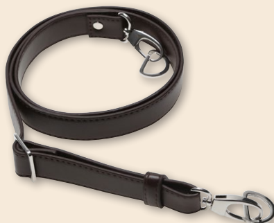
Taske skulderrem justerbar - 25 mm x 140 cm